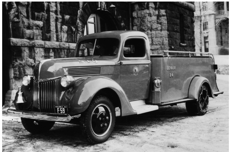
Voiture à boyaux Ford 1939 Caserne 14 (Source : Archives Ville de Québec (No 01123) – 1940)